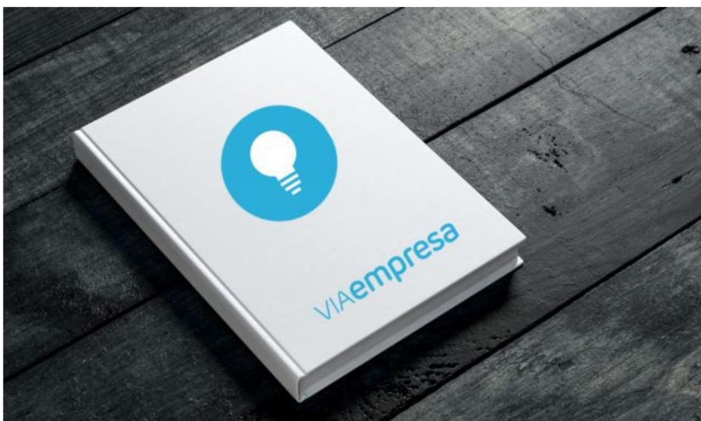
El racó del lector de VIA Empresa

Fa un mes que no sortim, en fa quasi dos que no treballem i no ho tornarem a fer fins a finals d'estiu, amb sort.